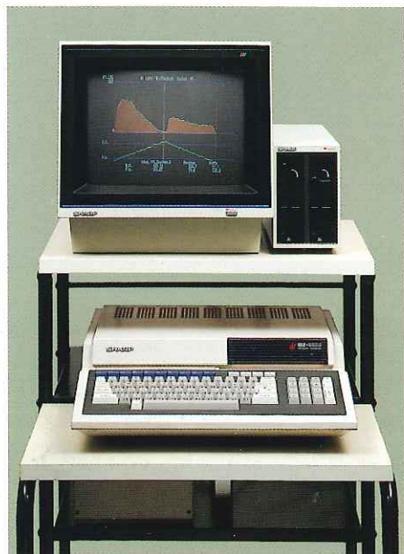
サイベックスバイオフィードバックコンピュータシステム一式

カラーディスプレイですから美しいグラフィックが可能です。勿論、高性能・高速なCPUを使用していますので、ソフトの拡張も自由自在で、多様なニーズに真価を発揮します。更にフロッピーユニットにより、情報は格納記憶され、将来の統計処理も可能となるコンパクトなシステムです。