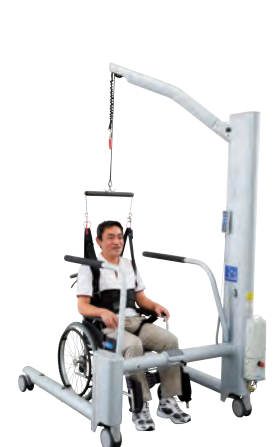
▲アンウェイシステムネクステップと ゲイトトレーニングシステム3.1を組み合わせた使用例です。