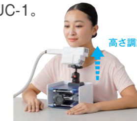
コイルスタンド (UC-1用)

PMSコイルUC-1は、狭い範囲に集中した磁気刺激を行えます。不要な部位を刺激せずに、局所的に強力な渦電流を誘発して「強縮」を起こすことも可能です。