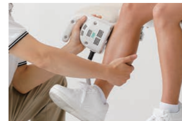
下腿：前脛骨筋（足関節背屈）