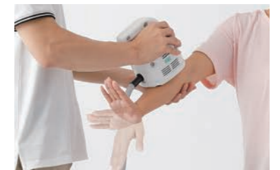
前腕：総指伸筋（手指関節背屈）