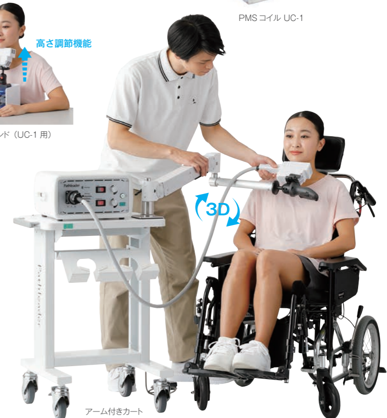
アーム付きカート

アームは、三次元に自由な調節・固定ができるので臥位や座位など様々な姿勢での刺激が可能です。コイルスタンドは座高に合わせて調節できるように、高さ調節機能が付いています。