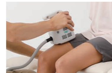
大腿：大腿四頭筋（膝関節伸屈）