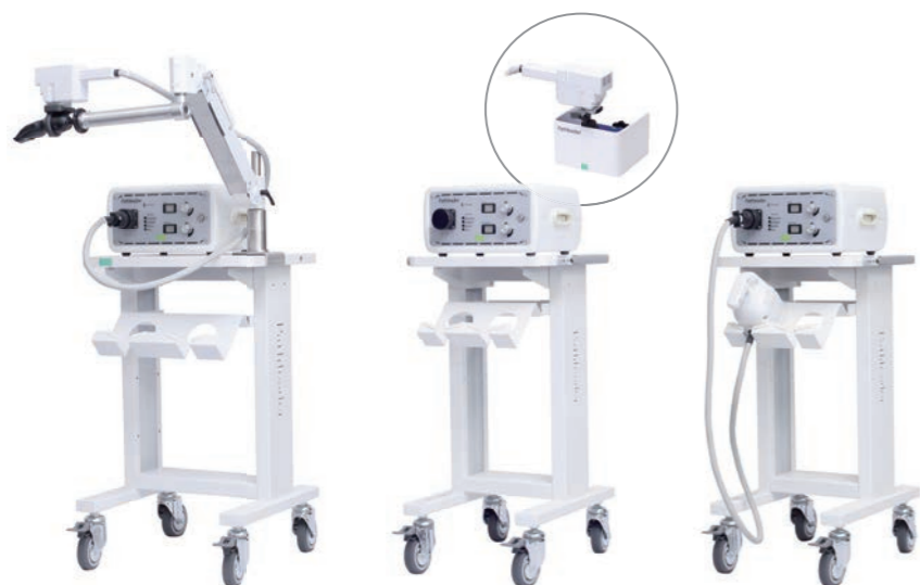
パスリーダー アーム付カートセット