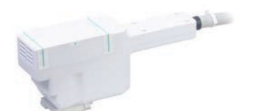
PMS コイル UC-1