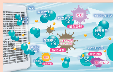
低濃度オゾン発生装置 エアネスシリーズ

エアネスは部屋の空気から低濃度オゾンを作り、同時に発生するイオン気流で拡散させます。