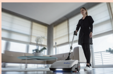
SHS/ハイジェニックオートモップ

360°動くハンドルで狭く低い場所でも楽々洗浄。除菌洗剤「ハイジェニック除菌クリーナー中性」併用できれいに清潔に!