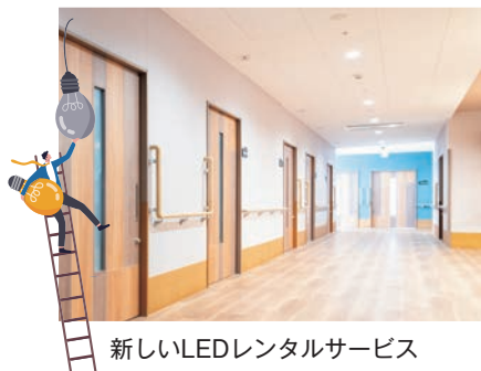
新しいLEDレンタルサービス

LED化、新電力、空調制御システム、電子ブレーカーなど、さまざまな電気代削減案をご提案。