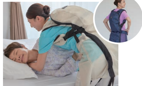
パワーアシストスーツ J-PAS fleairy

体の動きに応じて適切な力でアシスト。介助のほか、体の負担になるさまざまな作業をサポートします。