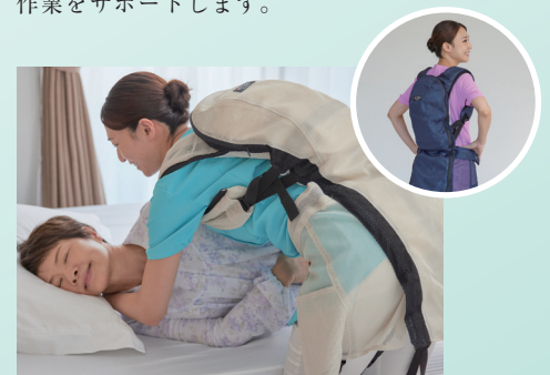
パワーアシストスーツ J-PAS fleairy

体の動きに応じて適切な力でアシスト。 介助のほか、体の負担になるさまざまな 作業をサポートします。