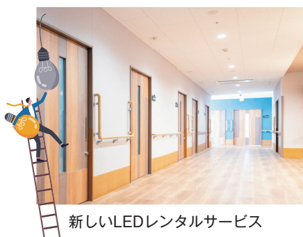
新しいLEDレンタルサービス

LED化、新電力、空調制御システム、 電子ブレイカーなど、さまざまな電 気代削減案をご提案。