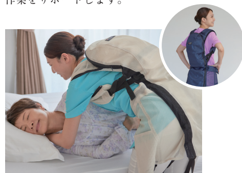
パワーアシストスーツ J-PAS fleairy

体の動きに応じて適切な力でアシスト。 介助のほか、体の負担になるさまざまな 作業をサポートします。