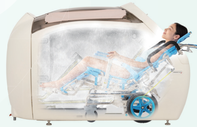
シャワーポッド アラエル 全身をしっかり洗えて介助時間も短縮。

*マイクロバブル・ウルトラファインバブルは株式会社サイエンスの製品を使用しています。