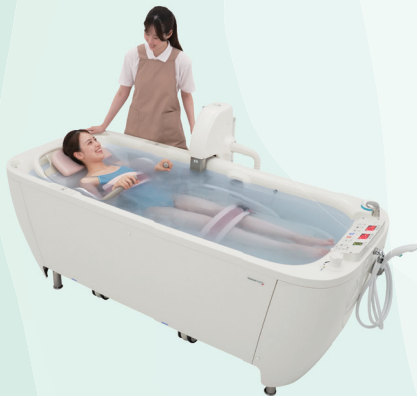
リフト&バス リクシー マイクロバブル仕様 マイクロバブル搭載でしっかりきれい。

*マイクロバブル・ウルトラファインバブルは株式会社サイエンスの製品を使用しています。