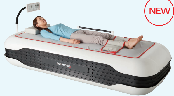
水圧マッサージベッド アクアベッド プライム