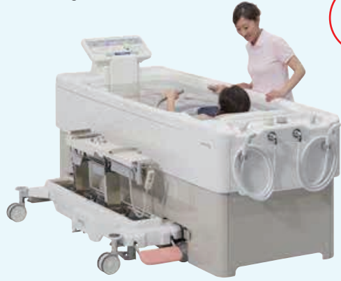
新型仰臥位浴槽 シルフィード